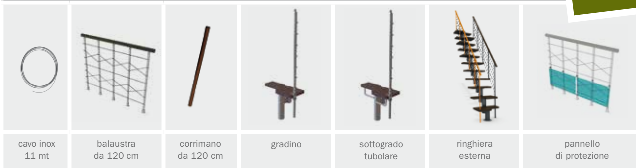
cavo inox 11 mt